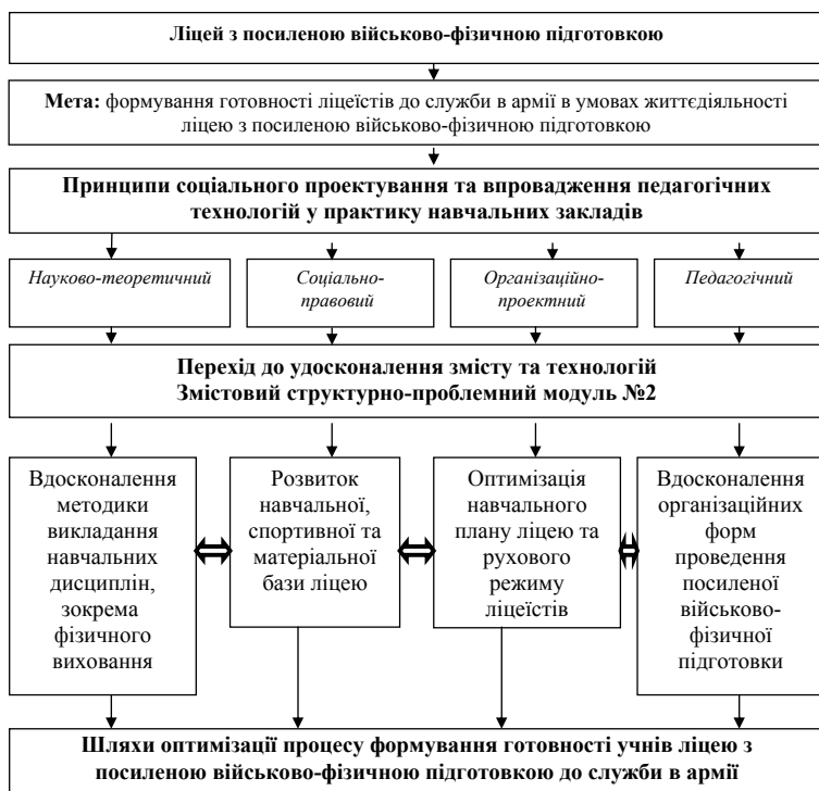
Рис. 1. Модель формування основ готовності до служби в армії в учнів ліцеїв з посиленою військово-фізичною підготовкою (продовження II частини)

В своїх попередніх дослідженнях ми розпочали розгляд змісту нових концептуальних підходів в організації навчально-виховного процесу в ліцеї з посиленою військово-фізичною підготовкою через призму формування фізкультурно-соціальних основ культури поведінки майбутніх військових. Для детального розуміння структури і змісту наукової проблеми, нами було розроблено концептуальну модель – презентовано першу її частину (рис.1), яка розкриває змістові, організаційні та діяльнісні складові формування основ способу життя ліцеїстів, учнів ліцеїв з посиленою військово-фізичною підготовкою. Ця модель розкриває, на нашу думку, нові можливості ліцею з посиленою військово-фізичною підготовкою щодо організації власної діяльності з урахуванням специфіки закладу та індивідуальних особливостей 15-17 річних ліцеїстів і покращить співпрацю закладу з сім'єю ліцеїста.