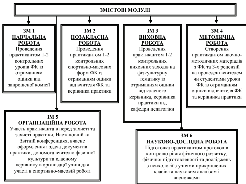
Рис.2. Обов'язкові контрольні заходи і форми роботи

студентів, яка буде підтримана безперервним та систематичним вивченням базових дисциплін, взаємозв'язком науково-теоретичного та методично-практичного навчання студента з включенням відповідного змісту, методів і форм професійної діяльності.