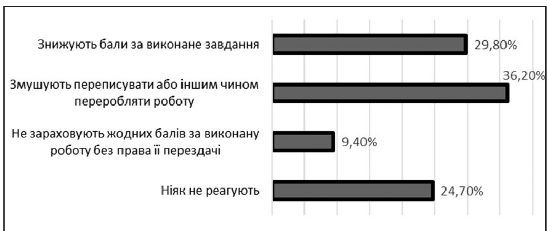
Рис. 4 Результати відповідей студентів ЧНУ ім. Петра Могили щодо реакції викладачів на прояви академічної недоброчесності студентами [4, с.38]

ють переробляти виконану роботу, або взагалі не зараховують бали і не дозволяють перездавати роботу (рис. 4).