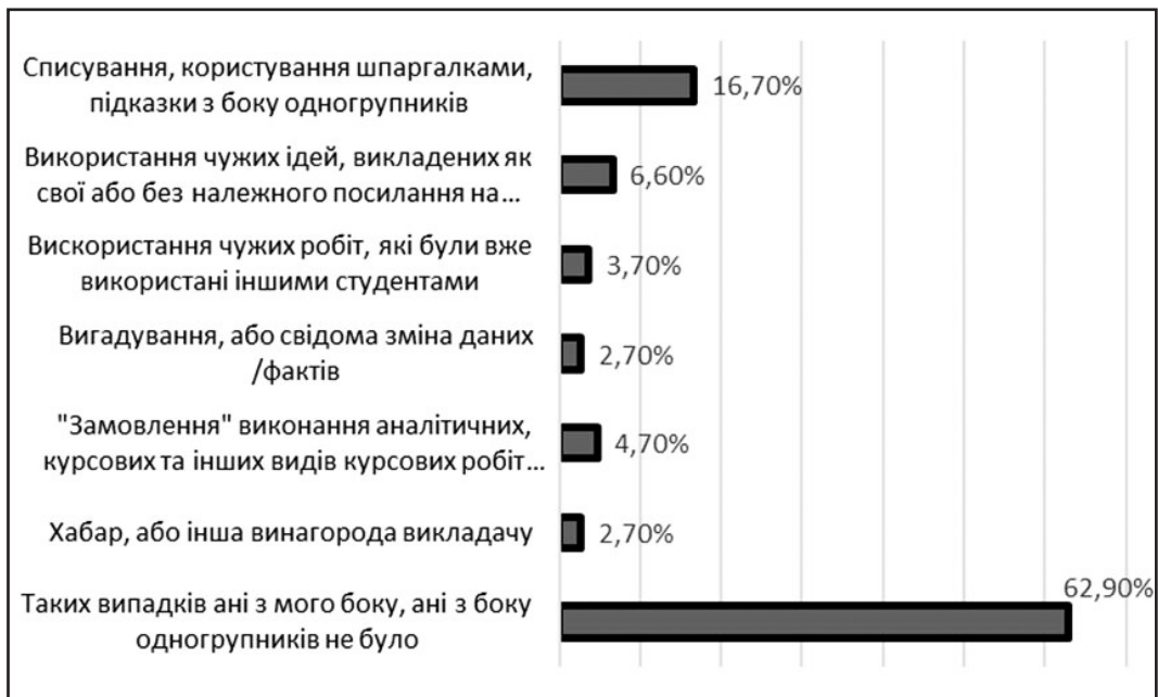
Рис. 3 Результати відповідей студентів ЧНУ ім. Петра Могили на питання: «Чи вдавалися до проявів недоброчесності особисто Ви протягом періоду навчання або достовірно знаєте конкретні випадки з боку Ваших одногрупників?» [4, с. 37]

На думку більшості студентів (75,4 %), викладачі перешкоджають проявам академічної недоброчесності: знижують бали за виконане завдання, змушу-